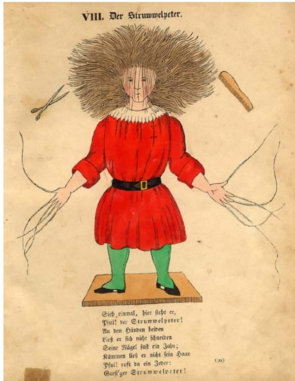
Nr. 23: Hoffmann, Struwwelpeter, 2nd Edition

ANTIQUARIAT WINFRIED GEISENHEYNER Postfach 480155, 48078 Münster-Hiltrup Roseneck 6, 48165 Münster-Hiltrup Tel.: 0 25 01/78 84 – Fax: 0 25 01/1 36 57 e-mail: rarebooks@geisenheyner.de / www.geisenheyner.de